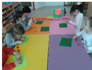
Pâte à modeler