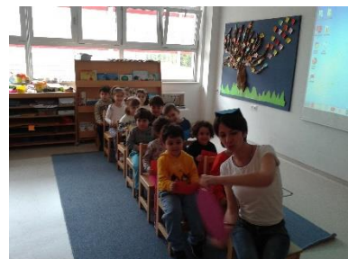
Dans le bus (otobüste)